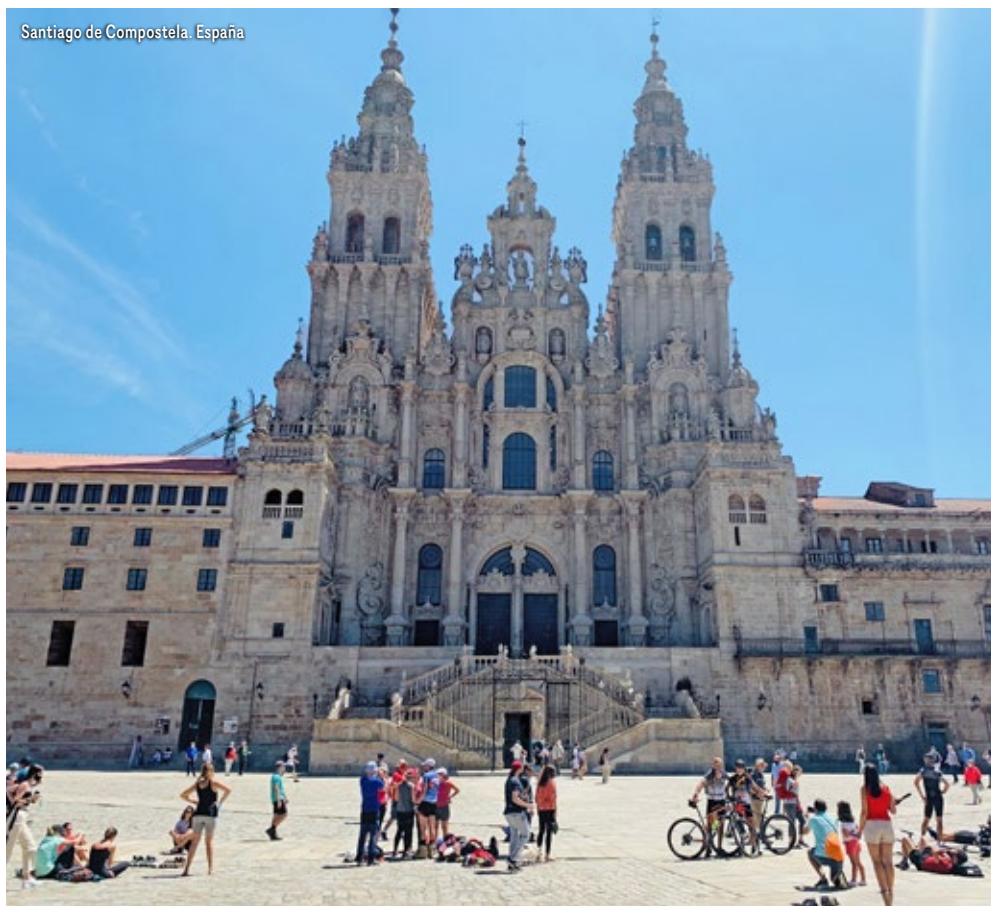
Santiago de Compostela. España

El equipaje tendrá que depositarlo en la recepción del hotel/pensión antes de las 8:00 hrs. Desayuno. Última etapa por el interior. El río Xallas nos sigue acompañando en la subida hacia Hospital. Más adelante se encuentra la bifurcación que señala el Camino hacia Muxía para aquellos que deseen realizar esta variante. En este caso nosotros seguimos dirección Cee. Pasamos por el Cruceiro Marco de Couto, la Ermita de Nuestra Señora das Neves y por la Capilla de San Pedro Mártir hasta llegar a Cruceiro da Armada, donde por primera vez vemos el mar. Aquí comienza un empinado descenso hasta nuestro destino de hoy, Cee. Alojamiento.