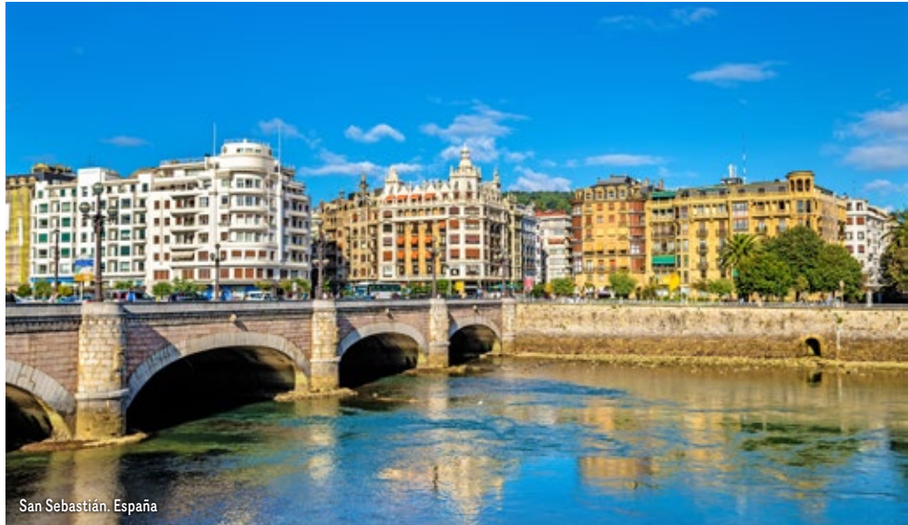
San Sebastián. España

Desayuno. Salida vía Guadix, Baza y Puerto Lumbreras hacia la Costa Mediterránea para llegar a Valencia. Alojamiento. Resto del día libre.