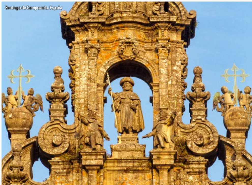
Santiago de Compostela. España

las más bonitas puestas de Sol en el "Fin del Mundo". Alojamiento en Fisterra.