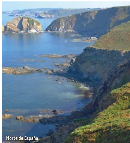
Norte de España