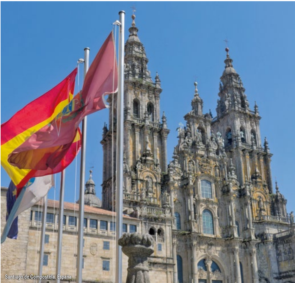
Santiago de Compostela. España

Desayuno. Visita de la ciudad, destacado centro de peregrinación, donde recorreremos la emblemática Plaza del Obradoiro y admiraremos la majestuosa Catedral, símbolo espiritual y artístico de Santiago. Tarde libre con posibilidad de participar en alguna de nuestras excursiones opcionales. Cena y alojamiento.