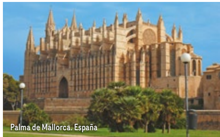
Palma de Mallorca. España