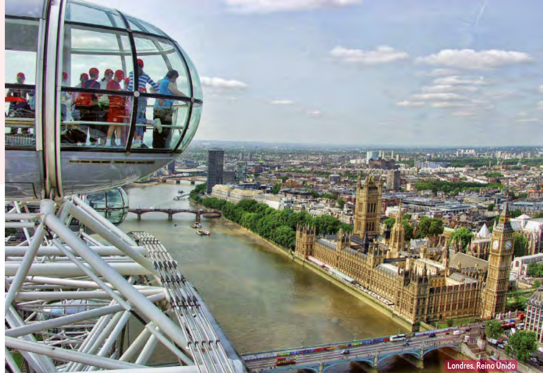
Londres, Reino Unido

Alojamiento y desayuno. Por la mañana visita panorámica de la Ciudad Luz para conocer sus lugares más emblemáticos como la Place de la Concorde, Arco del Triunfo, Campos Elíseos, Isla de la Ciudad con la imponente Iglesia de Notre Dame, Palacio Nacional de los Inválidos donde se encuentra la tumba de Napoleón, con breve parada en los Campos de Marte para fotografiar la Torre Eiffel. Por la tarde, recomendamos realizar nuestra excursión opcional, visitando el barrio de Montmartre o barrio Latino.