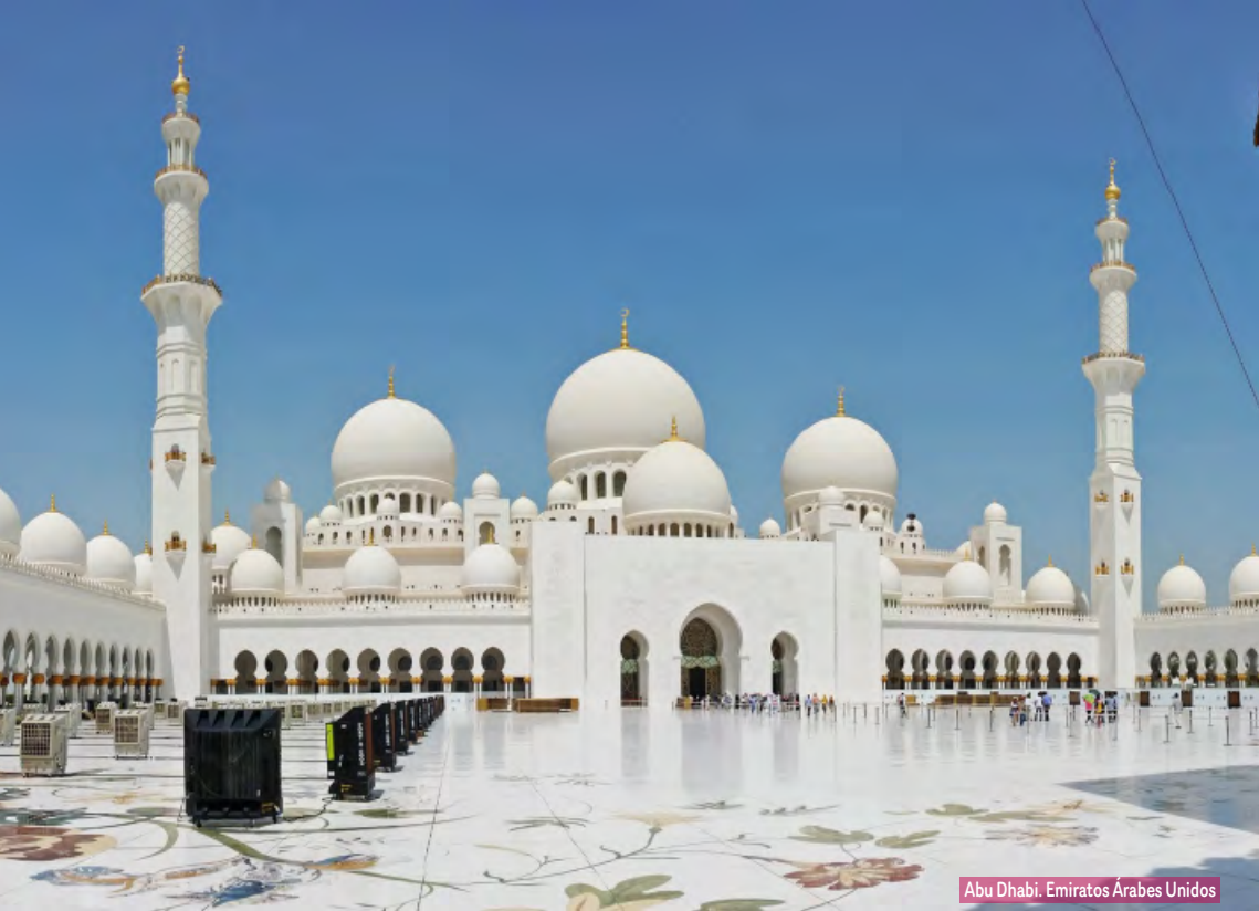
Abu Dhabi. Emiratos Árabes Unidos

Árabe, y el antiguo arte de la Danza del Vientre. Sobre las 21:30 hrs regreso al hotel. Alojamiento.