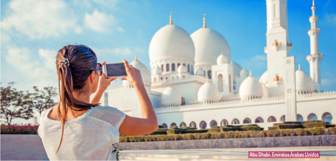
Abu Dhabi. Emiratos Árabes Unidos