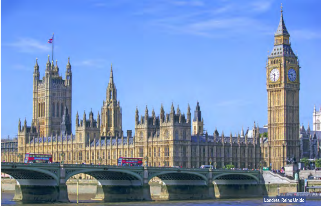
Londres. Reino Unido