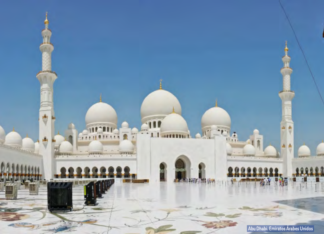
Abu Dhabi. Emiratos Árabes Unidos

Árabe, y el antiguo arte de la Danza del Vientre. Sobre las 21:30 hrs regreso al hotel. Alojamiento.