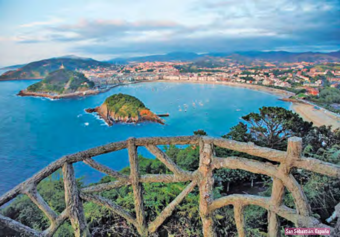
San Sebastián, España