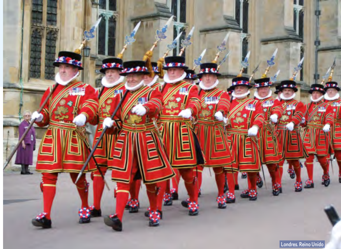
Londres. Reino Unido

Desayuno. Salida hacia Rotemburgo. Tiempo libre para admirar esta bella ciudad medieval que conserva sus murallas, torres y puertas originales, contemplar sus típicas calles y la antigua arquitectura germana. Continuación a través de la Ruta Román-