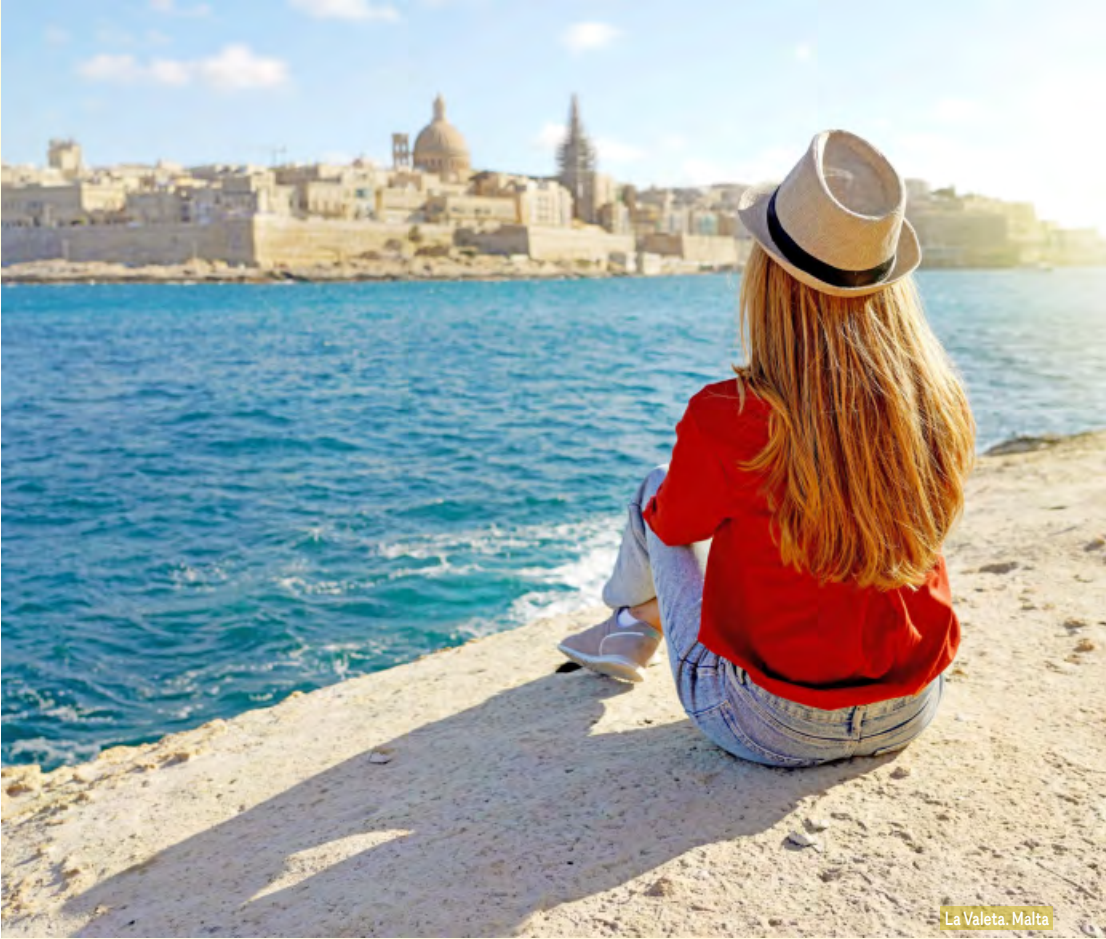
La Valeta, Malta