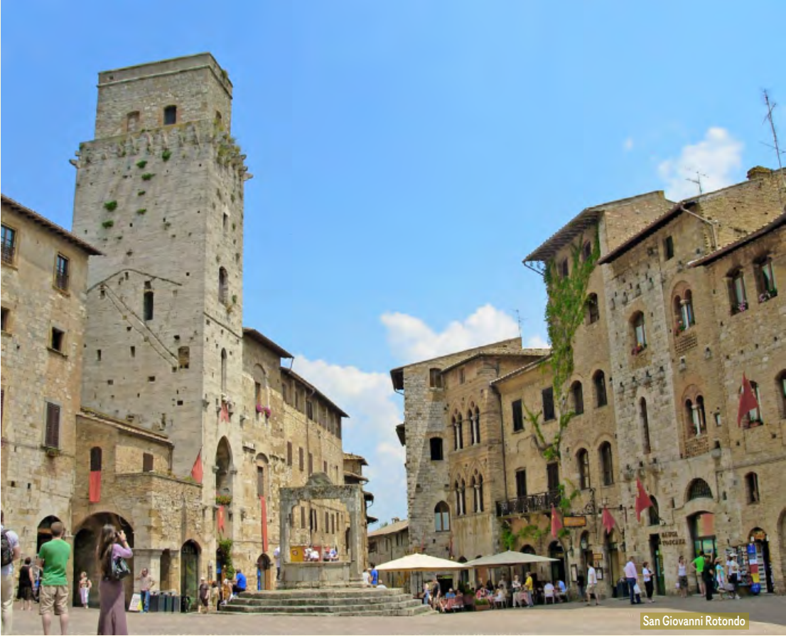
San Giovanni Rotondo

Nota: Por motivos organizativos, el itinerario puede ser modificado o invertido sin previo aviso. En cualquier caso están garantizadas todas las visitas y excursiones mencionadas en el itinerario.