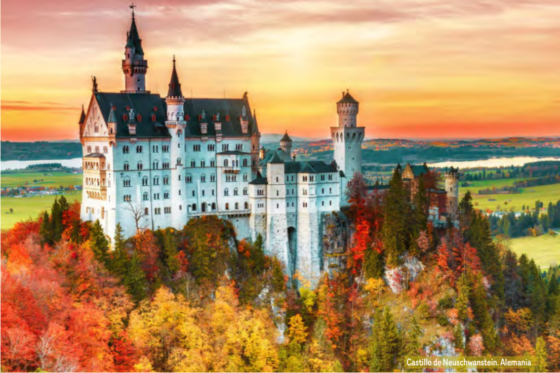
Castillo de Neuschwanstein. Alemania

Desayuno. Visita guiada de la ciudad. Continuación hacia Würzburg, ciudad que forma el límite norte de la Ruta Romántica. Después de la visita, regreso a Frankfurt. El tour finaliza en el Aeropuerto de Frankfurt alrededor de las 17:00 horas. Parada en el Hotel Mövenpick para los pasajeros con noches adicionales. Fin de nuestros servicios.