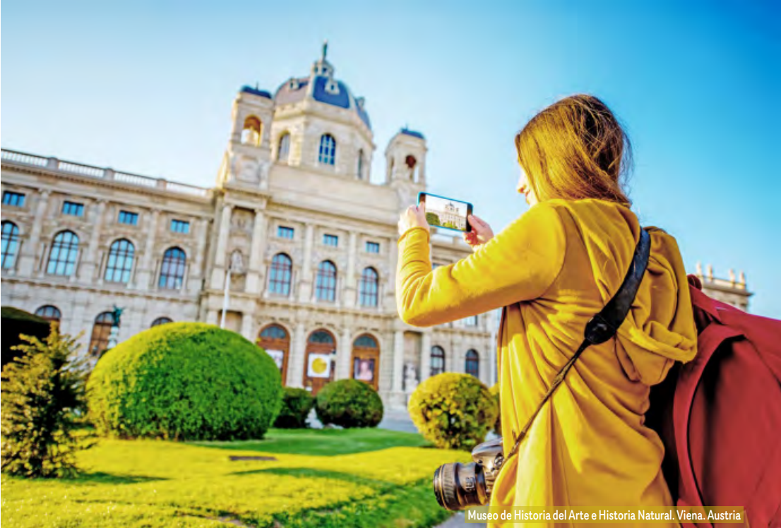
Museo de Historia del Arte e Historia Natural. Viena. Austria

Desayuno y salida hacia Suiza, con una parada en el Principado de Liechtenstein, el sexto país más pequeño del mundo, situado entre Austria y Suiza. Liechtenstein combina impre-