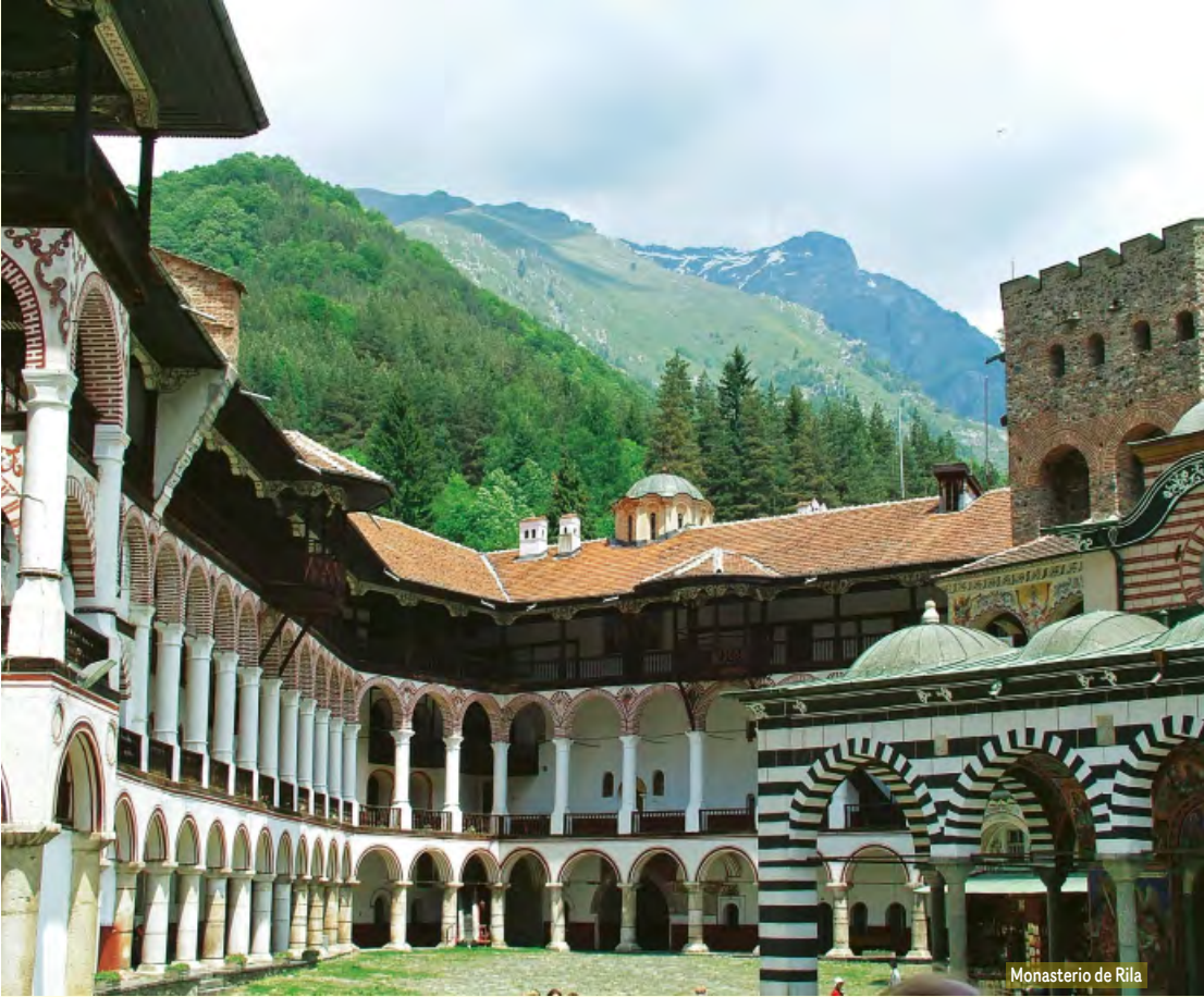
Monasterio de Rila

Consultar suplemento nocturno (de 20:00 h a 8:00 h).