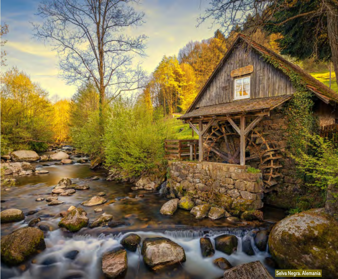
Selva Negra. Alemania

Desayuno. Salida hacia Stuttgart, una de las ciudades más verdes de Alemania, con un hermoso centro histórico y también sede de las famosas marcas Mercedes y Porsche. Visita panorámica y entrada al Museo Mercedes-Benz. El tour finaliza en el Aeropuerto de Frankfurt alrededor de las 17:00 horas. Parada en el hotel Mövenpick para los pasajeros con noches adicionales. Fin de nuestros servicios.