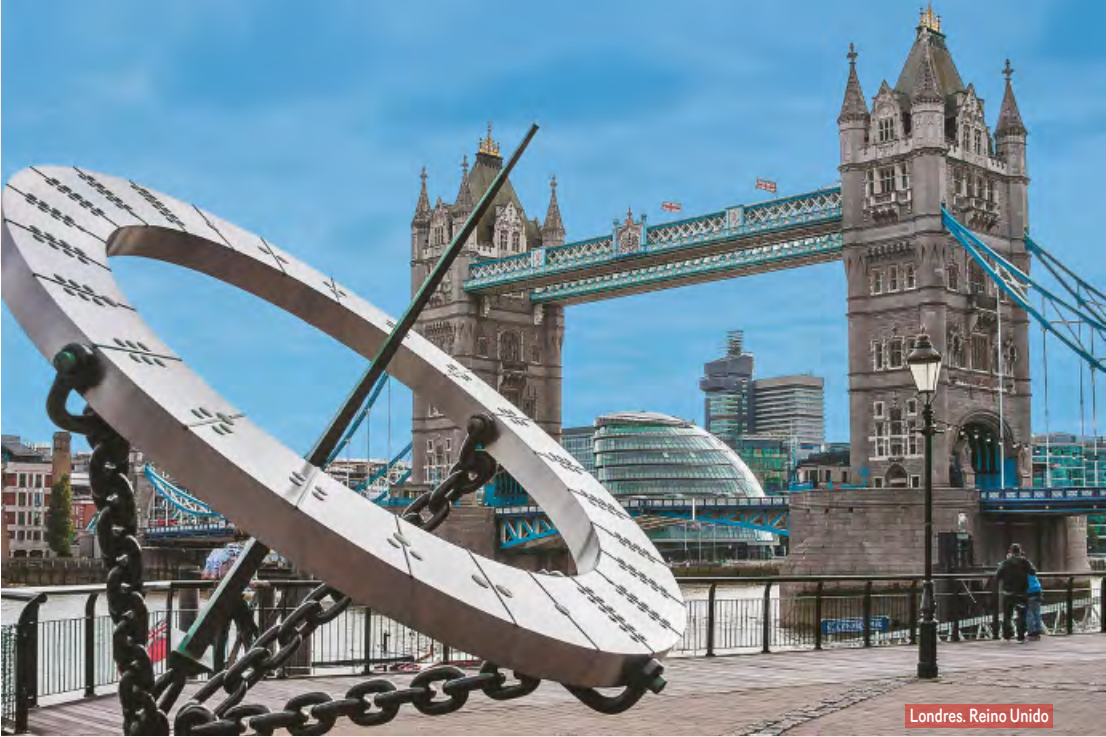
Londres. Reino Unido

Desayuno y fin de nuestros servicios. Posibilidad de ampliar su estancia en España o participar en un circuito por Andalucía o Portugal.