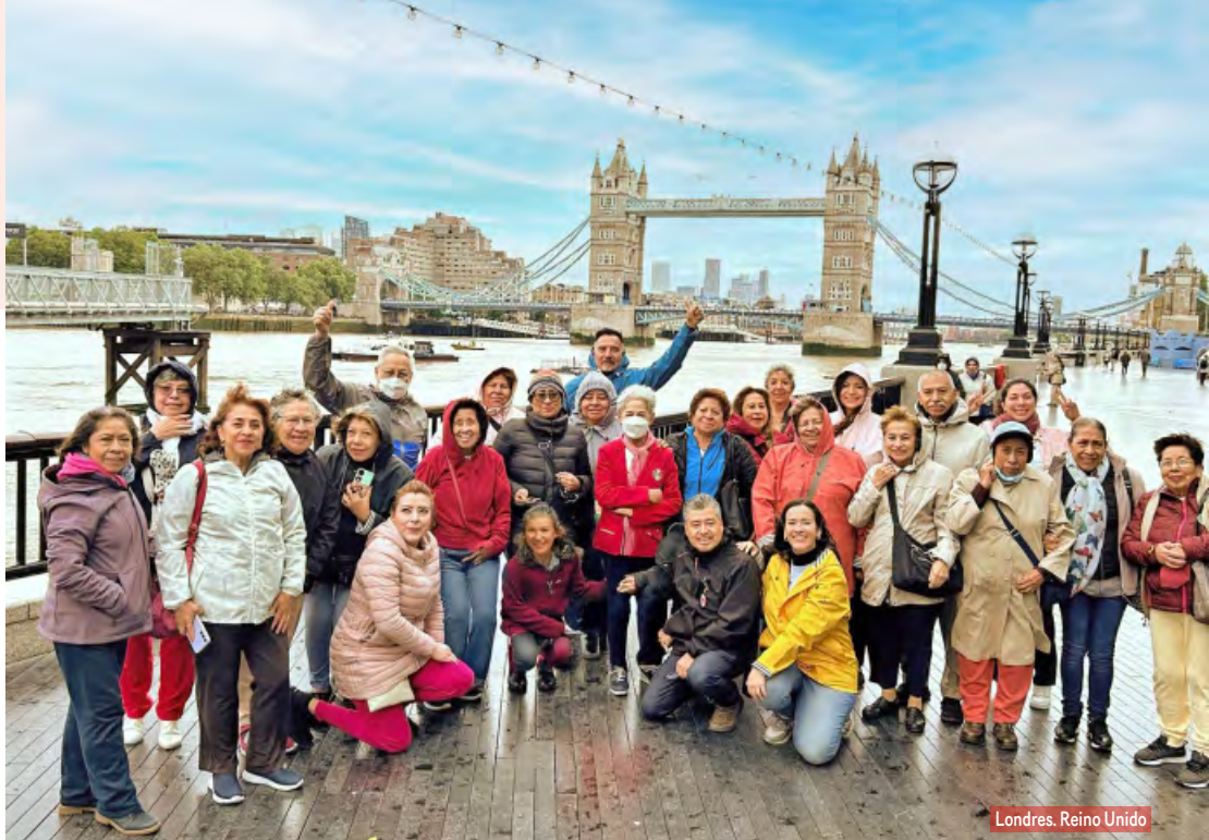
Londres, Reino Unido