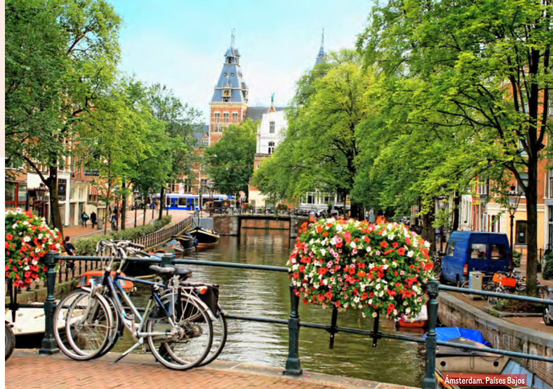
Ámsterdam. Países Bajos

Desayuno y salida hacia Rotterdam, segunda ciudad en importancia de Holanda. Breve recorrido panorámico y continuación hacia La Haya, capital administrativa, con breve parada para conocer los edificios que contienen los distintos organis-