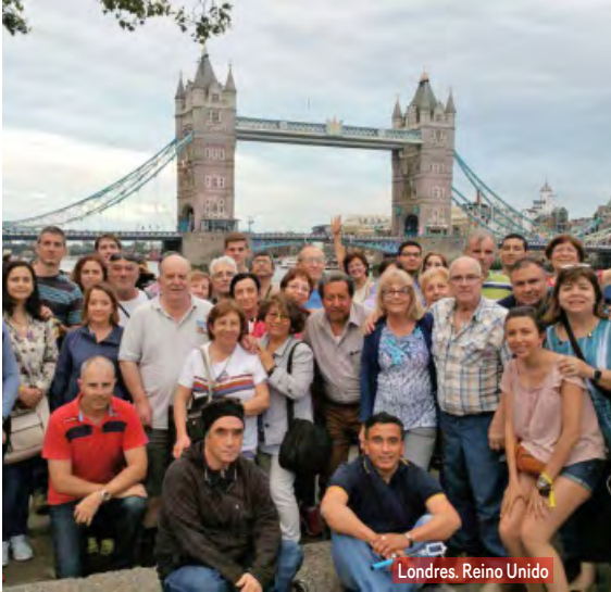
Londres. Reino Unido